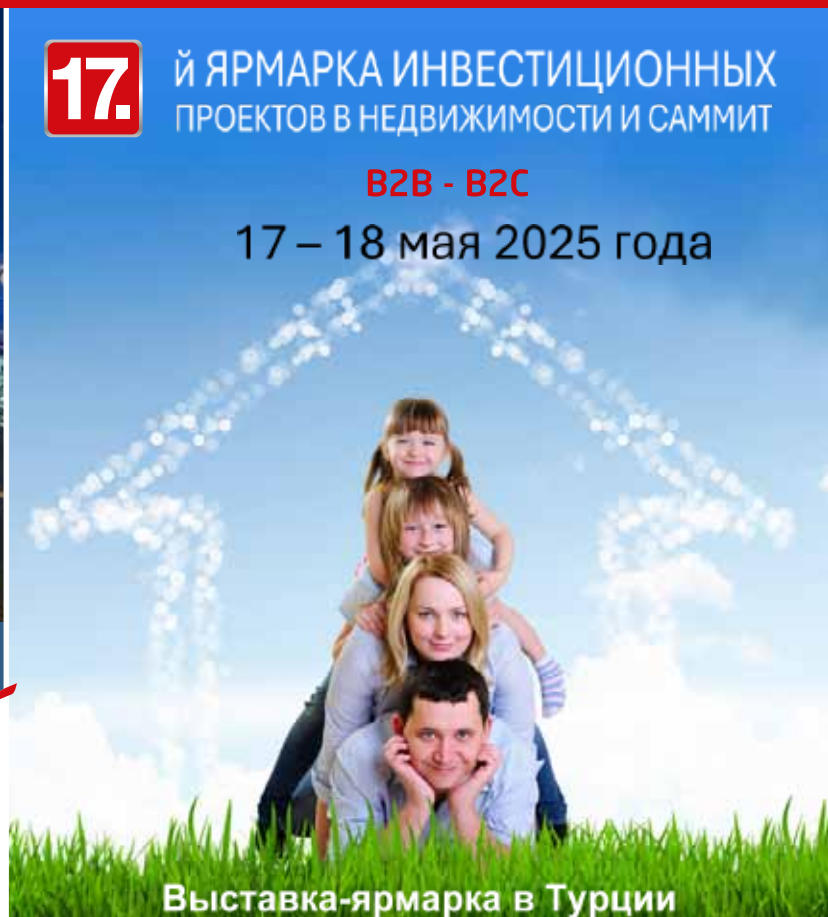
Выставка-ярмарка в Турции

СЕВЕРОКИПРСКАЯ ИНВЕСТИЦИОННАЯ КОНФЕРЕНЦИЯ, ВЫСТАВКА И САММИТ 17 – 18 мая 2025 года Конференц-центр Hilton Bosporus, Стамбул