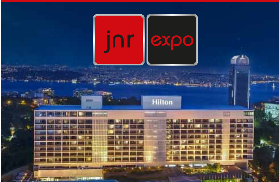
Конференц-центр Hilton Bosporus, Стамбул

СЕВЕРОКИПРСКАЯ ИНВЕСТИЦИОННАЯ КОНФЕРЕНЦИЯ, ВЫСТАВКА И САММИТ 17 – 18 мая 2025 года Конференц-центр Hilton Bosporus, Стамбул